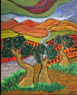
Árboles y río 48*35 cm 180€

Del lunes 29 de diciembre al lunes 26 de enero 2026