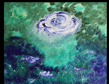
Cielo y copas V 41*32 cm 150€