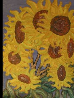
Girasoles 48*36 cm 180€