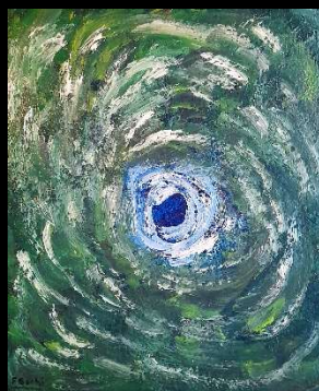
Cielo y copas III 43*38 cm 170€