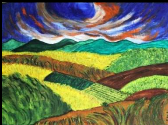
Campos Castilla 35*48 cm 170€