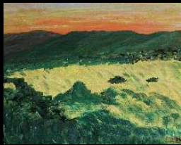
Amanecer 33*41 cm 120€