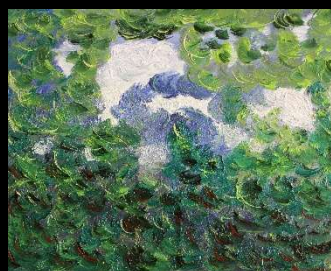
Cielo y copas IV 33*41 cm 150€