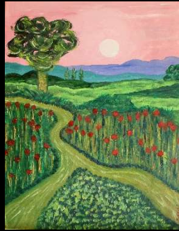
Campos amapolas 47*36 cm 180€