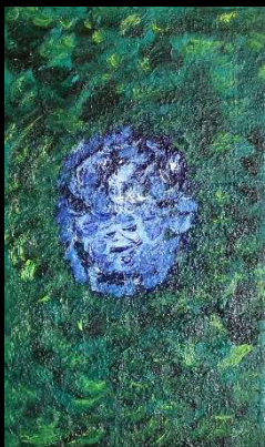
Cielo y copas II 55*33 cm 170€