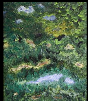
Cielo y copas I 46*38 cm 170€