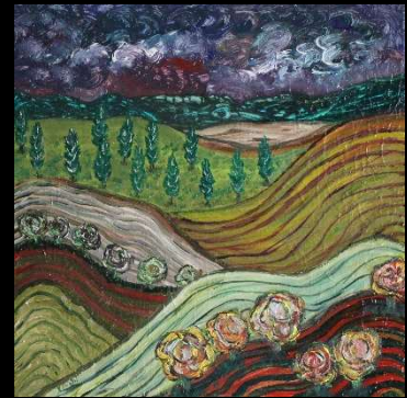
Campos ondulados 50*50 cm 180€