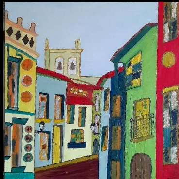
Pueblo de Castilla 60*60 cm 210€