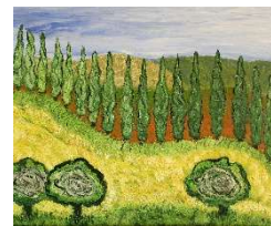
Árboles en línea 50x61 cm