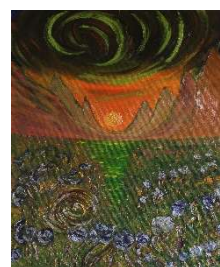
Montañas y lirios 61x50 cm