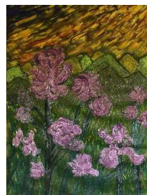
Lirios 68x51 cm