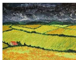
Campos y casas 36x47 cm