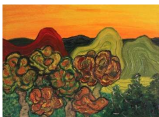
Árboles y montañas 73x100 cm