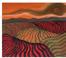
Soledad 50x60 cm