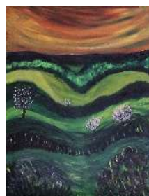
Campos ondulados 63x47 cm