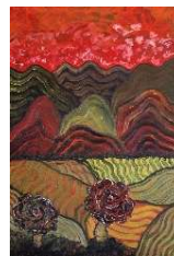
Montañas y campos 103x75 cm