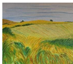
Campos amarillos 70x80 cm