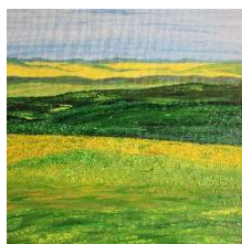
Campos en verdes 50x60 cm