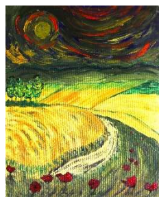
Día tormentoso 82x cm