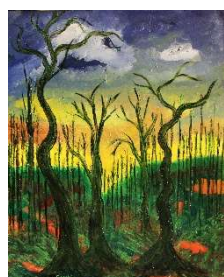
Bosque en invierno 81x65 cm