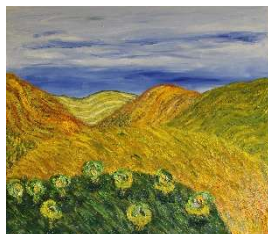
Montañas amarillas 71x81 cm