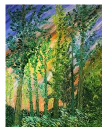
Bosque al clarear 92x73 cm