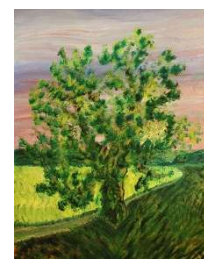
Verano 103x81 cm