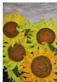
Girasoles voluptuosos 73x50 cm