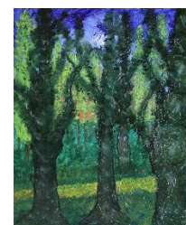
Bosque y cielo azul 61x50 cm