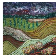
Campos ondulados 50x50 cm