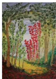
Bosque en primavera 103x72 cm