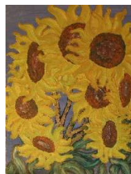
Girasoles 48x36 cm