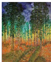
Bosque al amanecer 61x50 cm