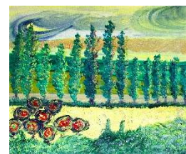
Campos, nubes y árboles 50x61 cm