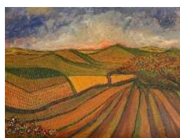
Campos en ocre 45x59 cm