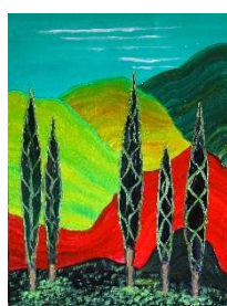
Montañas y árboles 79x60 cm