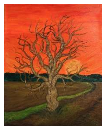
Invierno 102x80 cm