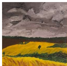
Viene la tormenta 50x50 cm