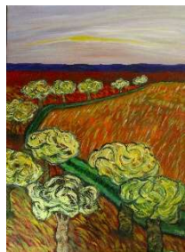
Árboles y camino 113x82 cm