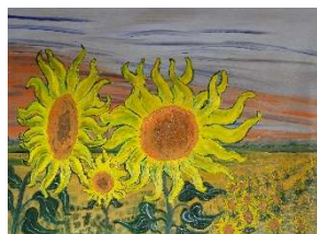
Girasoles 60x81 cm