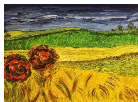
Árboles y trigo 50x70 cm