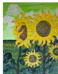
Girasoles 62x50 cm