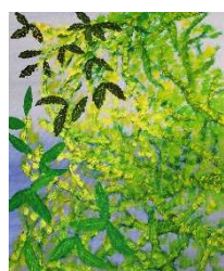
Hojas en verdes 100x80 cm