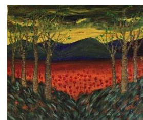
Campo de amapolas 50x59 cm