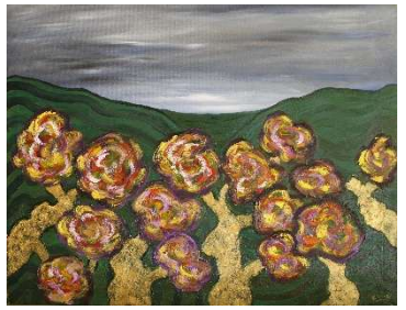
Montañas y árboles 60x75 cm