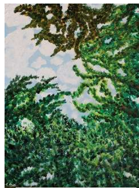
Trozo de cielo 80x60 cm