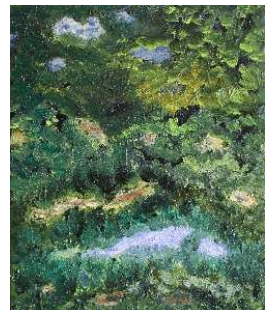
Cielo y copas verdes 46x38 cm