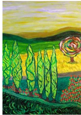
El intruso 91x63 cm