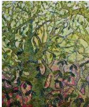
Frondosidad 100x80 cm