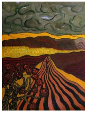
Campos sinuosos 114x88 cm