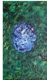
Cielo y copas 55x33 cm