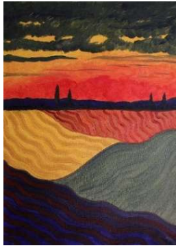
Cielo y campos 104x75 cm