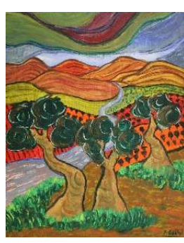
Campos y tres árboles 48x35 cm