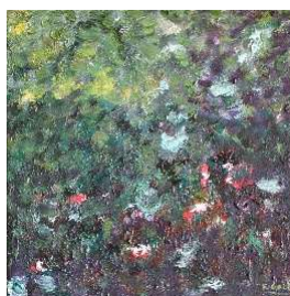
Cielo y copas 30x30 cm