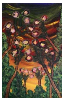
Cielo y árboles 63x41 cm