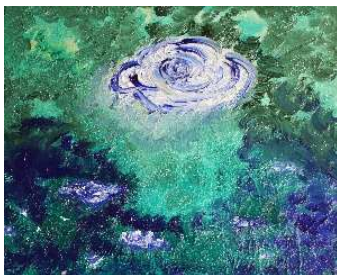
Cielo y ramas azules 41x32 cm