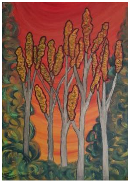
Árboles verticales 100x73 cm