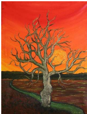
Invierno 75x58 cm