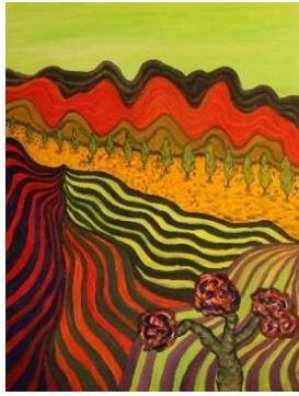
Campos sinuosos 118x91 cm