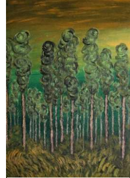
Árboles verdes 83x58 cm