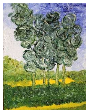
Árboles 35x27 cm