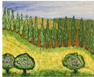
Árboles en línea 50x61 cm