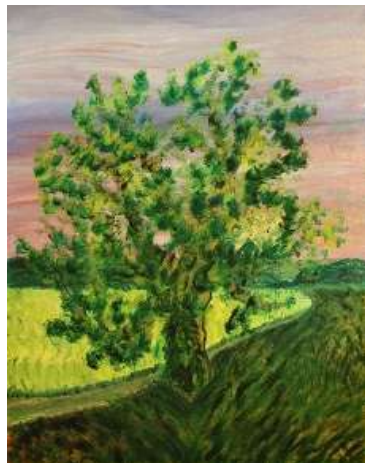
Verano 103x81 cm