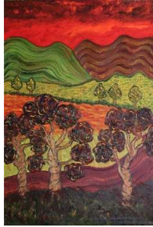
Campos y árboles 106x73 cm