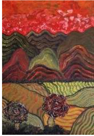
Montañas y campos 103x75 cm