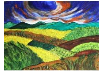
Campos de Castilla 35x48 cm