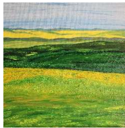
Campos en verdes 50x60 cm