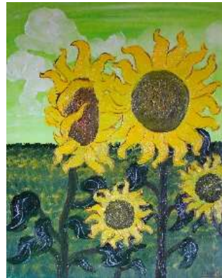
Girasoles 62x50 cm