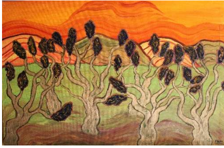
Árboles bailando 75x115 cm