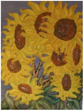
Girasoles 48x36 cm