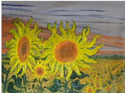
Girasoles 60x81 cm