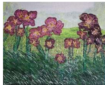
Campo de lirios 50x61 cm