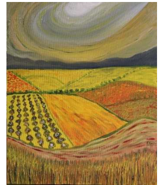
Campos de Castilla 61x50 cm