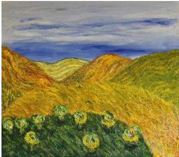
Montañas amarillas 71x81 cm