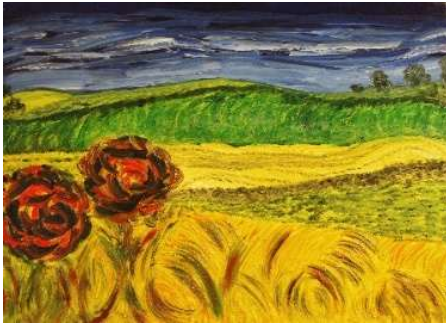
Campos de Castilla 50x70 cm 220€