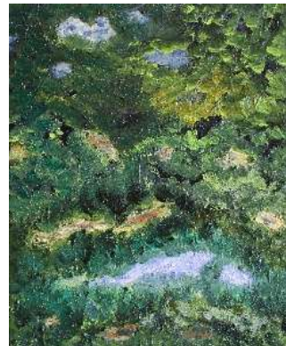
Cielo y copas 46x38 cm 150€