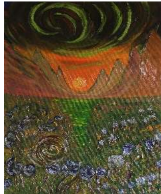
Montañas y lirios 61x50 cm 180€