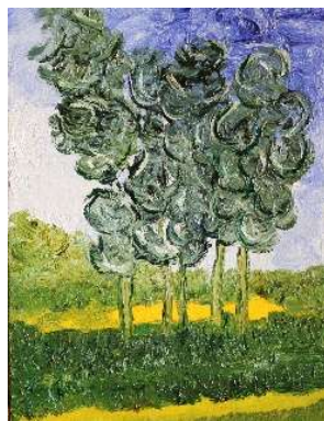
Árboles 35x27 cm 120€