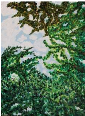
Trozo de cielo 80x60 cm 220€