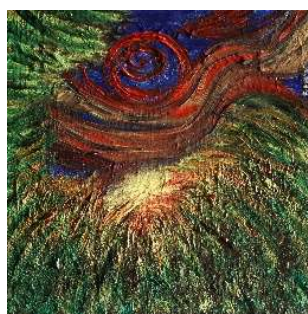
Cielo y copas 30x30 cm 120€