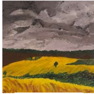
Tormenta 50x50 cm 180€