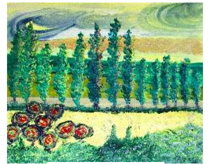
Árboles en línea 50x61 cm 180€