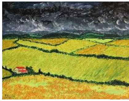
Campos de Castilla 35x48 cm 150€