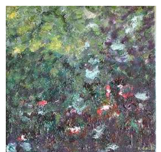
Cielo y copas 30x30 cm 120€