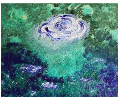
Cielo y copas 41x32 cm 150€