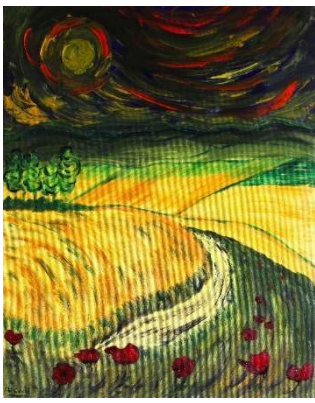
Día tormentos 82x65 cm 290€