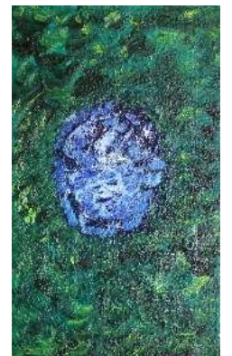
Cielo y copas 55x33 cm 150€