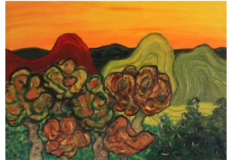
Árboles y montañas redondas 73x100 cm 290€