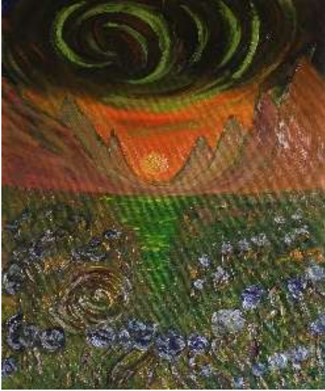
“De los horizontes de Castilla a las verticales del Norte”