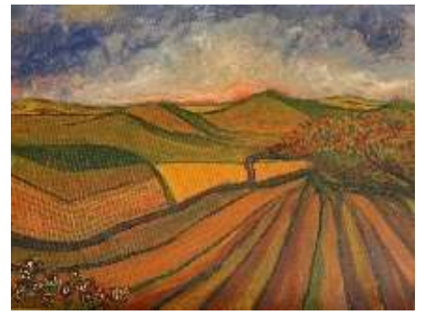
Campos en ocre 45x59 cm 180€